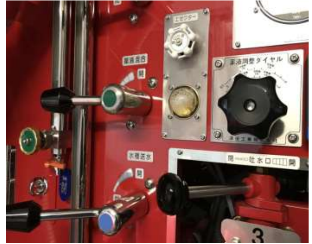
ポンププロポーションャー クラスB火災事案にも万全の装備