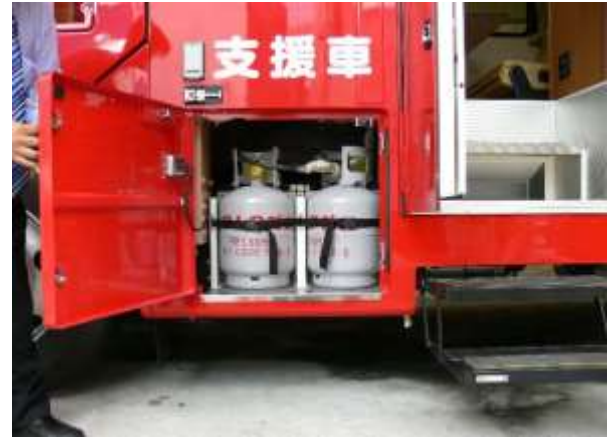
調理用にLPGボンベを装備