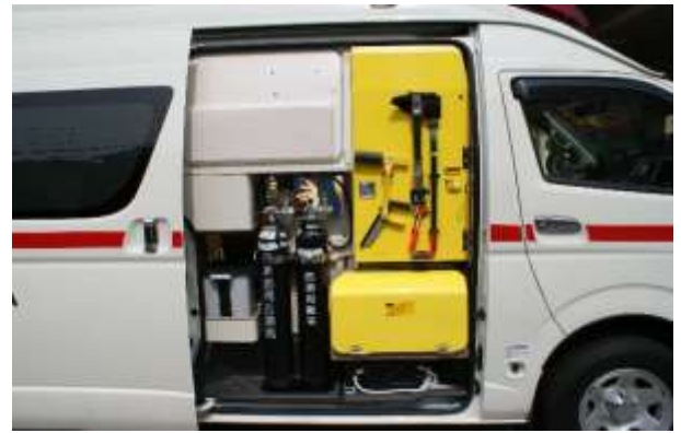
大型酸素ポンペを積載