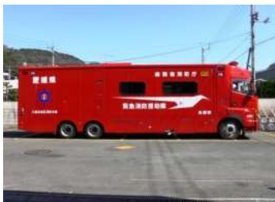
ツバメのマークは無事に帰れという願い