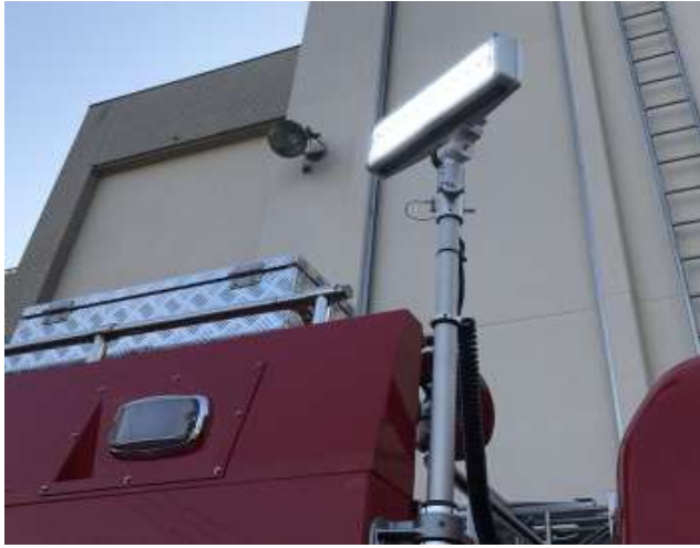
照明灯(LED式) 長尺伸縮柱付き