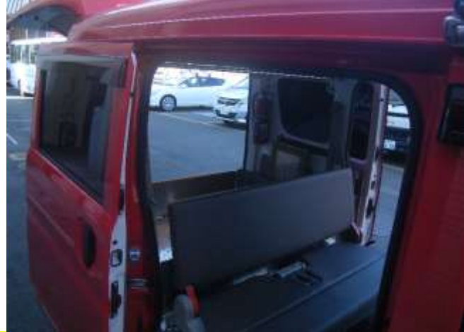
車両後部の様子、後部座席と収納ボックスを配置。基本的な使用方法。