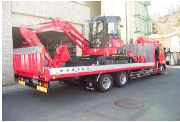
荷台に重機を積載して災害現場に出動します。