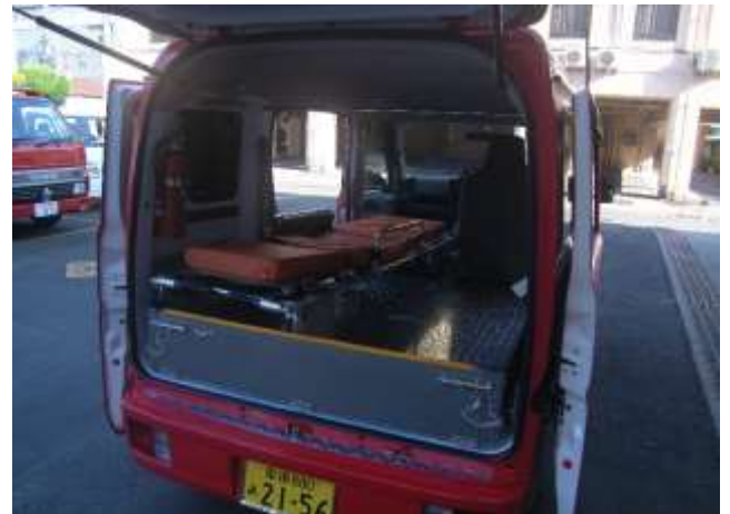
上記操作でスペース拡大後、担架を積載した様子。