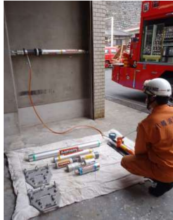
金属等を切断したり押し拡げたりできる油圧救助器具