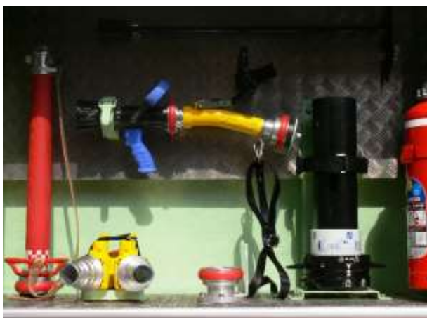
各種放水ノズルも装備