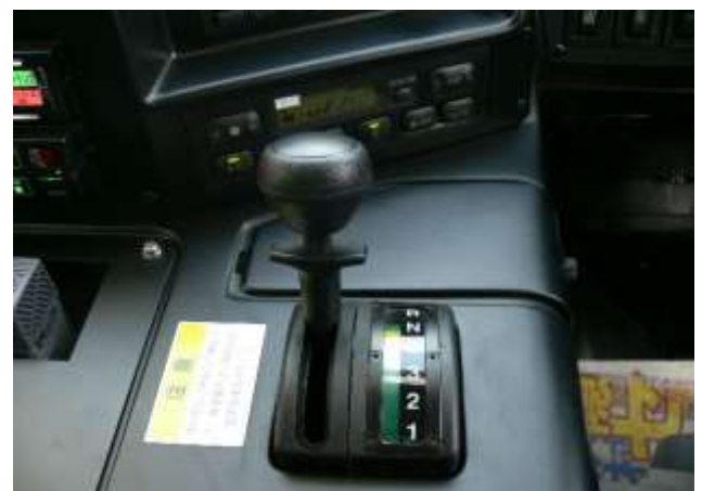
オートマチックで運転操作も快適