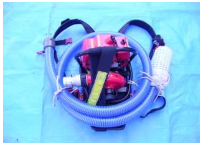
ウィックマンー式