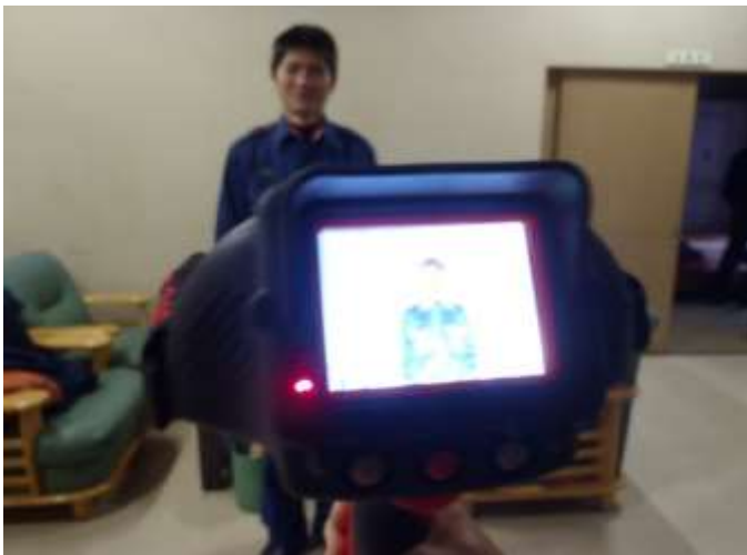
暗闇や火災の煙等で動けない人の熱を感知することができる熱画像直視装置