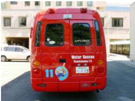
作業灯を装備し夜間でも安全