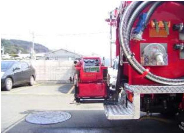
昇降式の可搬ポンプ積載器具