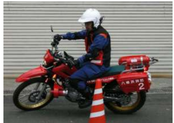
隊員訓練状況・装備品