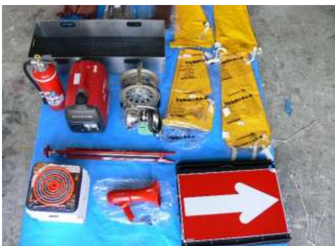
発電機・照明装置・感電防止等を装備