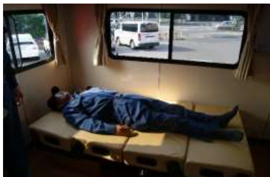
長期活動支援用にベッドを装備