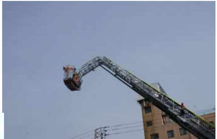
梯子先端部分を屈曲させた状態