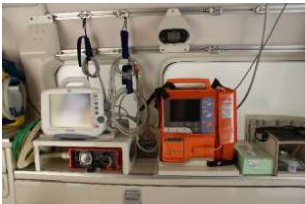
高度救命処置用資機材を装備