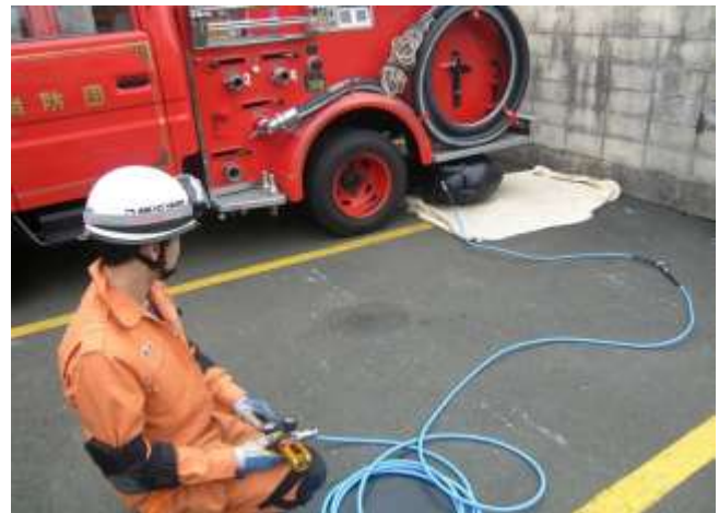
約50tの重量物も持ち上げられるエアージャッキ