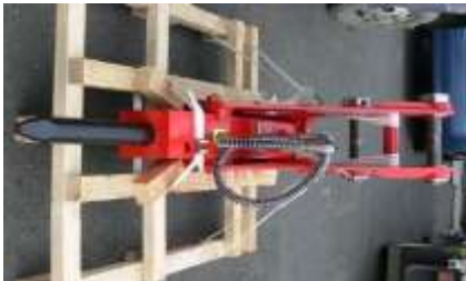
コンクリート、岩石の破壊