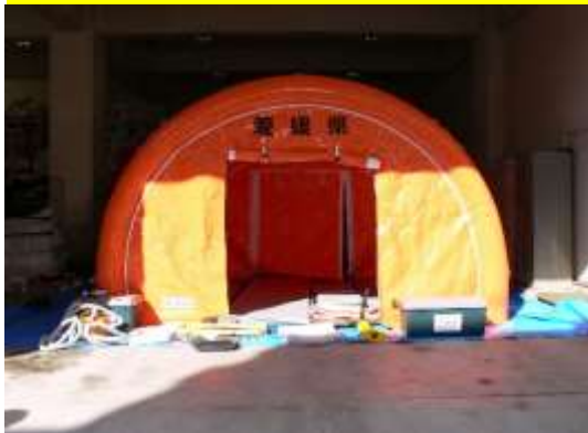
野営エアーテント類を装備