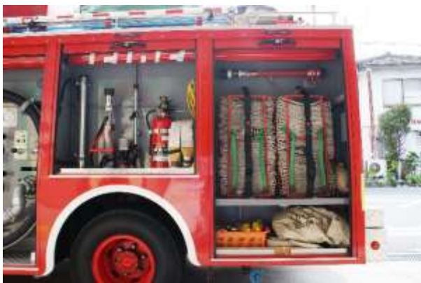
吸水・送水装置・消火器及びホースを装備