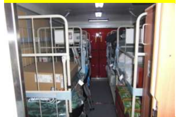
支援用資材を装備