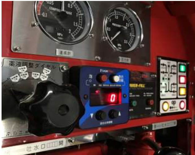
自動泡混合装置(フォームプロ) ワンタッチでクラスA泡消火薬剤が使用可能