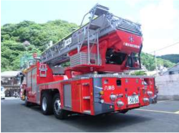
はしごはストロング梯体を採用しています。伸梯は全段が同時に伸梯します。