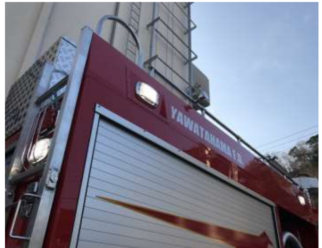
特殊広拡作業灯(LED式) 車両周辺の視界・安全を確保