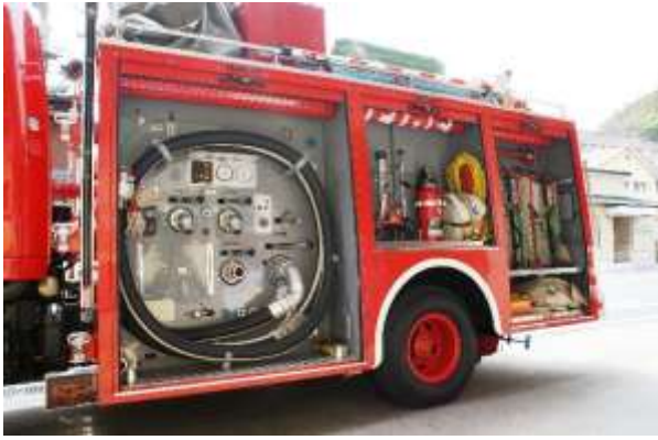
シャッター内部の装備品状況