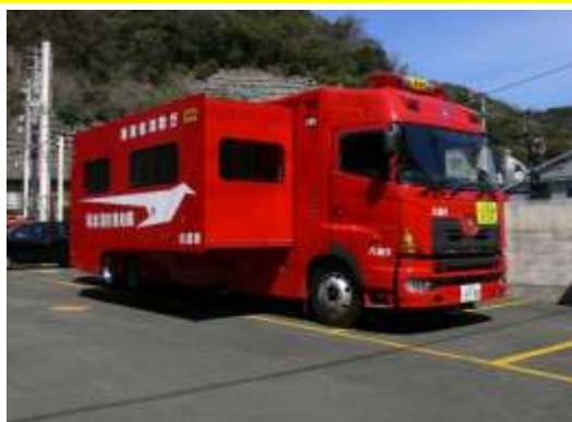
車中の部屋を広げたところ