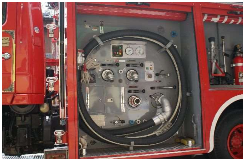
水利から吸水する吸管