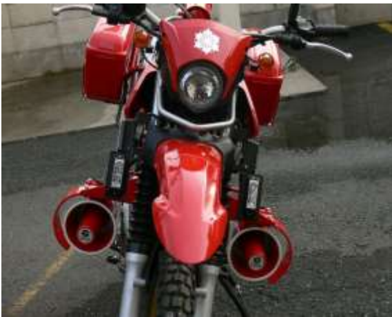
車両前部にサイレン、LED赤色灯を装備