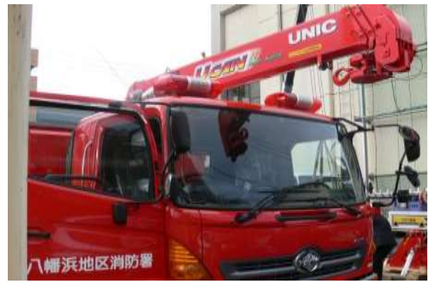
クレーンが装備され、がれき等の除去ができます。