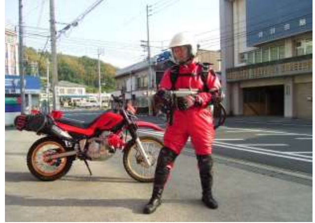
携帯式泡消火システムのポータブルキャブス(武蔵)も装備可能