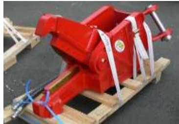
鉄骨の切断 コンクリートの破壊