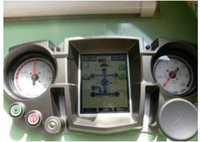
放水ポンプ操作盤・液晶パネル付き。