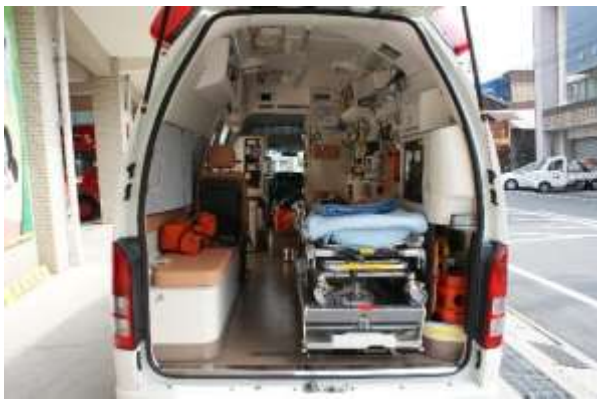
患者室内は十分な活動スペースを確保している。