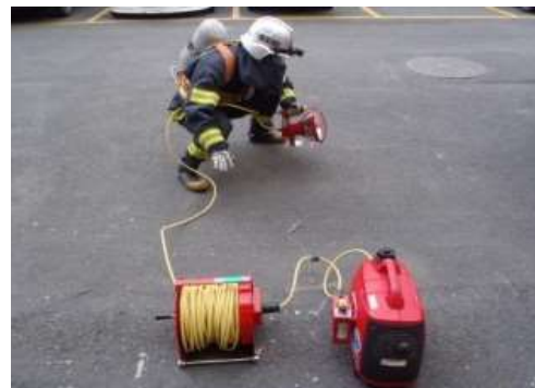
信号も送れる投光器