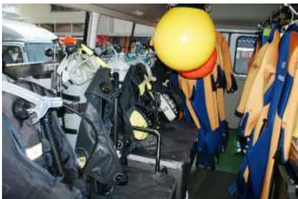
潜水資材 ウエットスーツ式