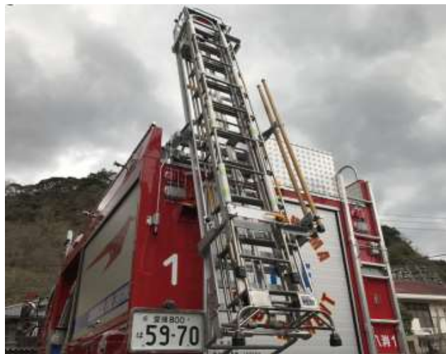
ダンパー式はしご昇降装置 3連・かぎ付はしごを積載