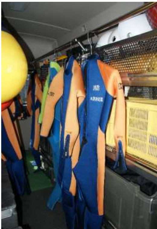
隊員は出動途中の車内で着替えをします。