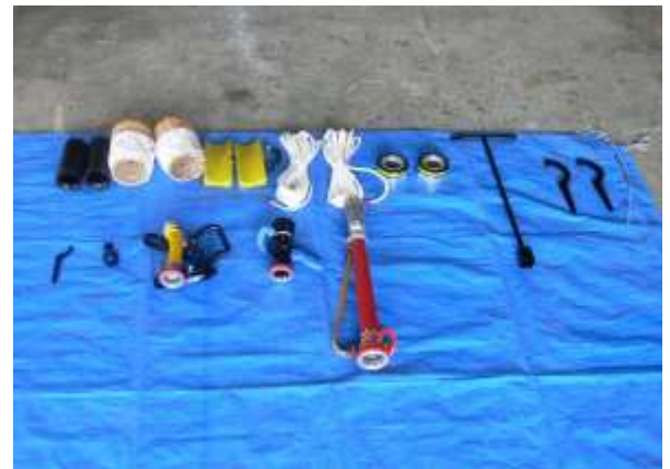
ポンプ関係備品を装備