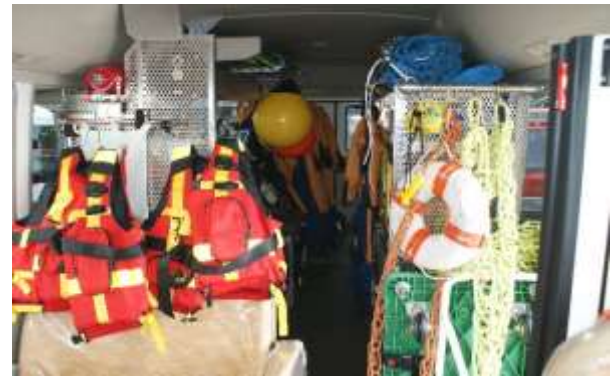
救助ブイ・水中検索ロープ類