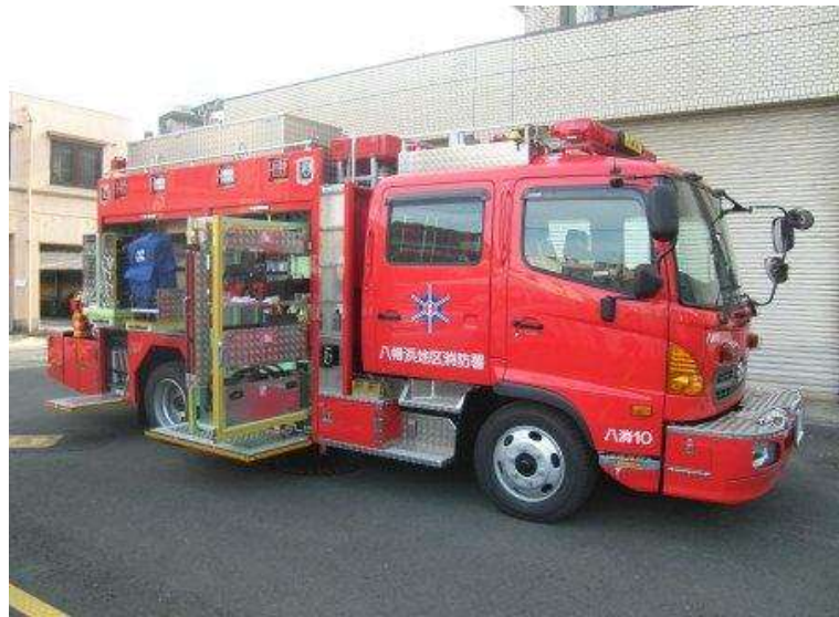
シャッター内部の資機材と積載状況