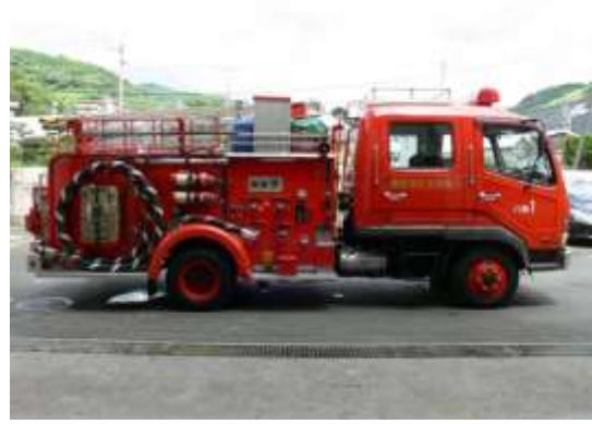
シャッターの設置されていない車両