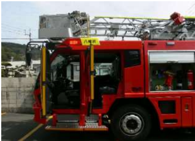
広々としたキャビンを有しています。