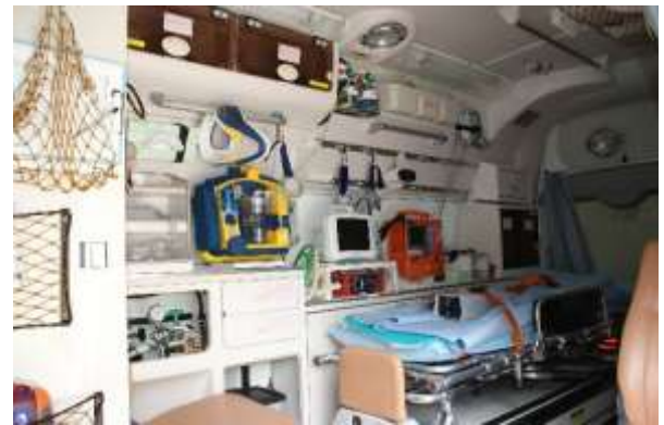
高度救命処置用資機材を装備