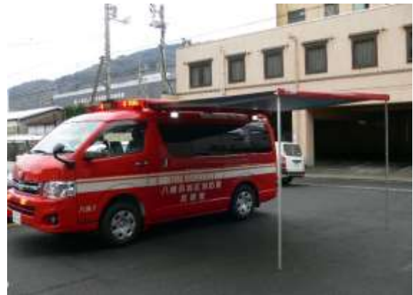
サイドオーニング