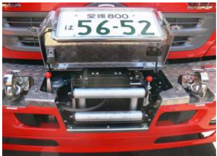
車両前・後部にウィンチ、後部にクレーンを装備しています。