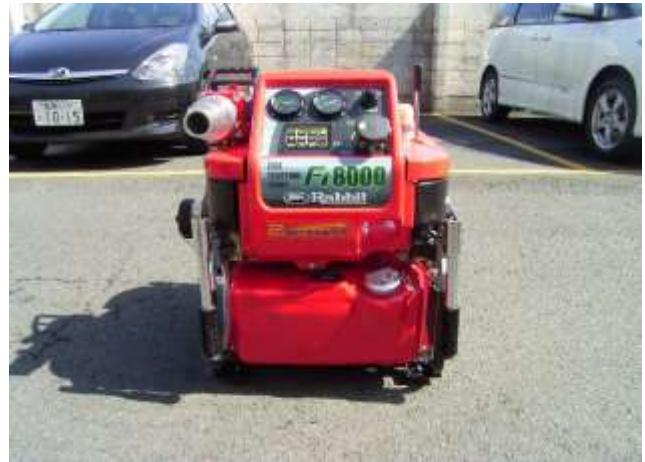
自動吸水装置付可搬ポンプ