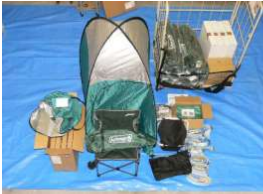
簡易テント類を装備