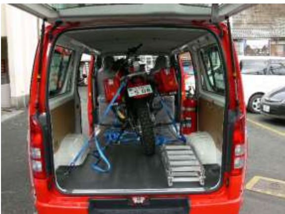
車両に積載して移動可能