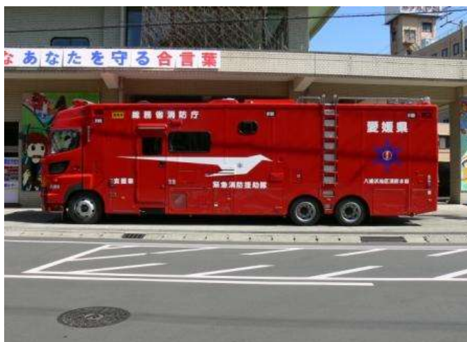
左側のドアから中に入ります。 たくさんの消防隊員が寝泊まり することができます。