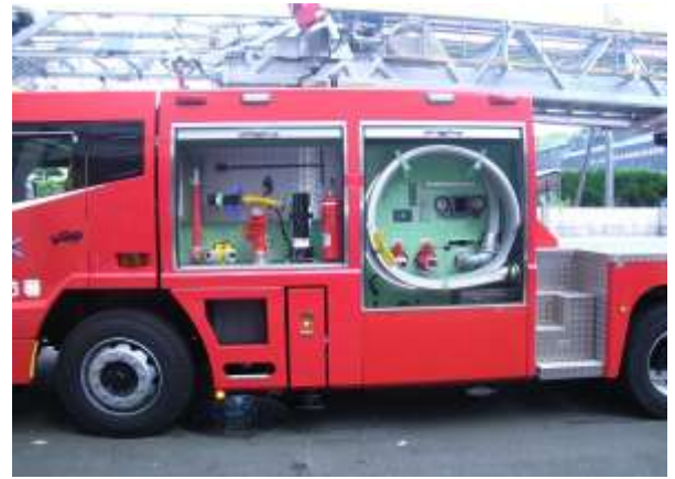
放水ポンプ機能も装備しています。