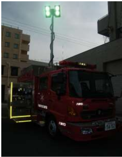
車両上部の照明装置