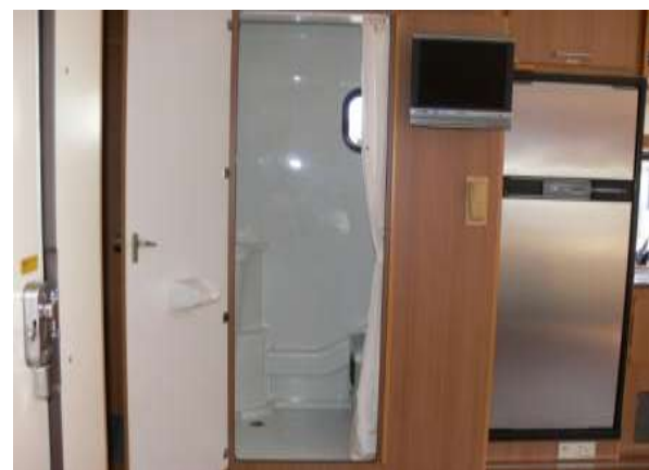
シャワー・トイレ・テレビがあります。