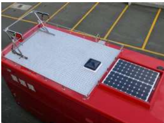
指揮台とソーラーパネルを装備