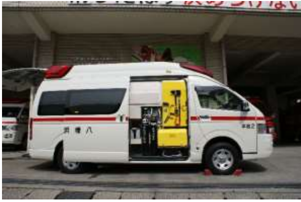
右側スライドドア内にレスキュー資機材4点セットを装備