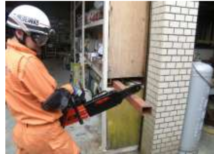
金属も切断できるチェーンソー