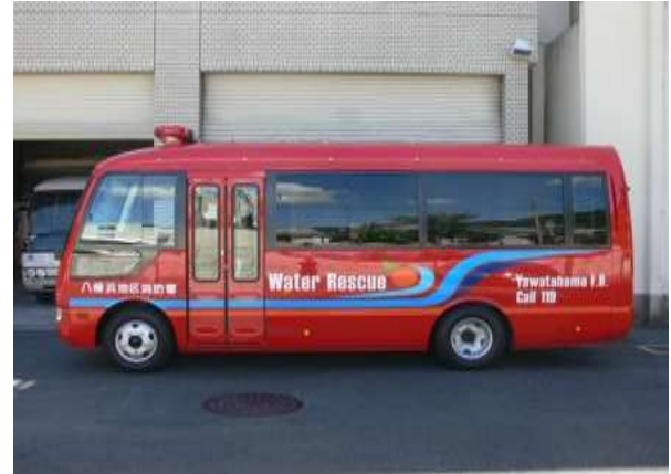
マイクロバスを改造し潜水資材を搬送