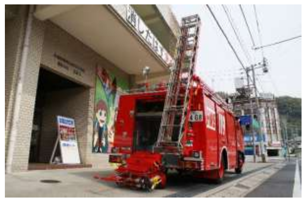
ホースカー及び三連梯子を装備