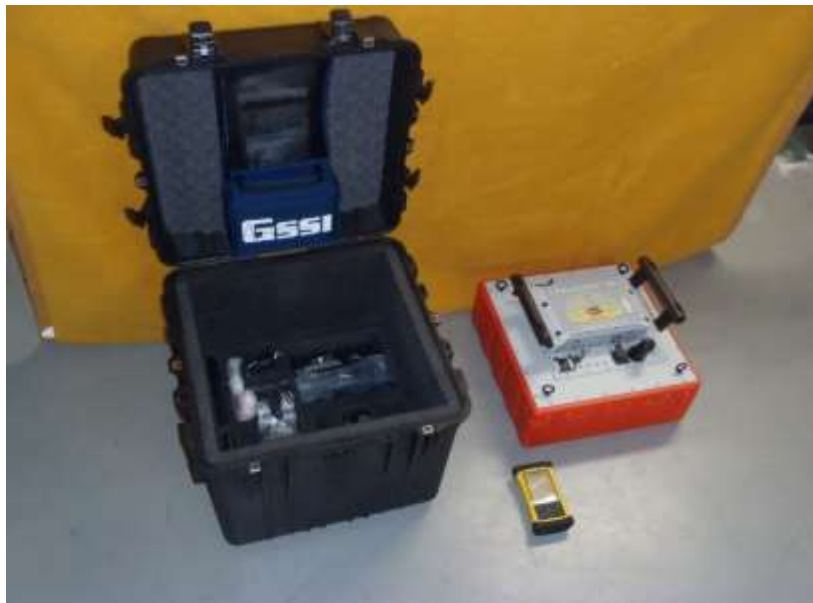
埋もれている人のわずかな呼吸、動きでも検知できる電磁波探査装置