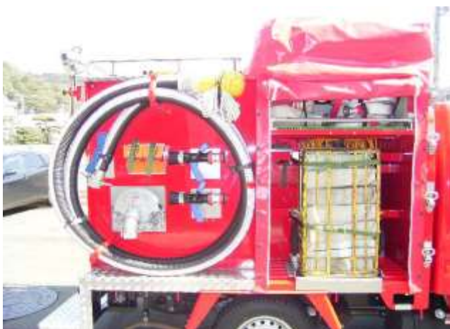
吸管及びノズル・ホースを装備