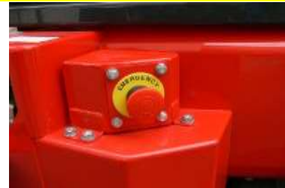
消防専用仕様としてラジコン・搭載モードにかかわらず、本スイッチを操作するとエンジンが停止し車両を緊急停止させることができます。