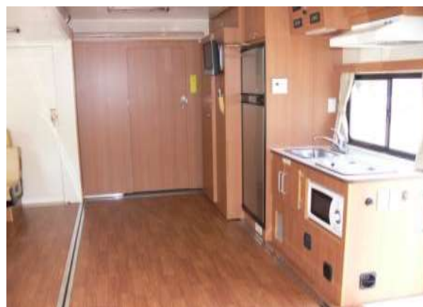
とびらの奥にはベットがあります。