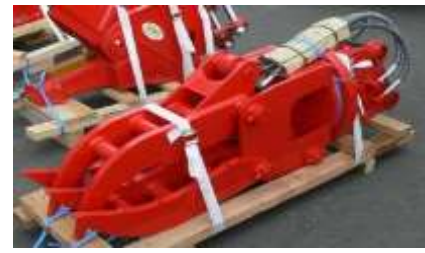
家屋の解体 がれきの集積・積込