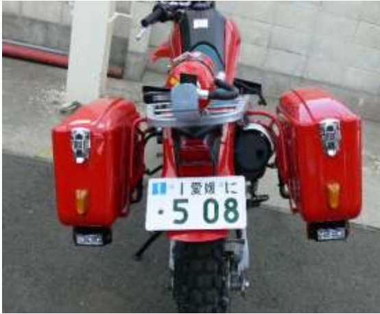
車両後部両サイドに収納ボックス、LED赤色灯を装備している。