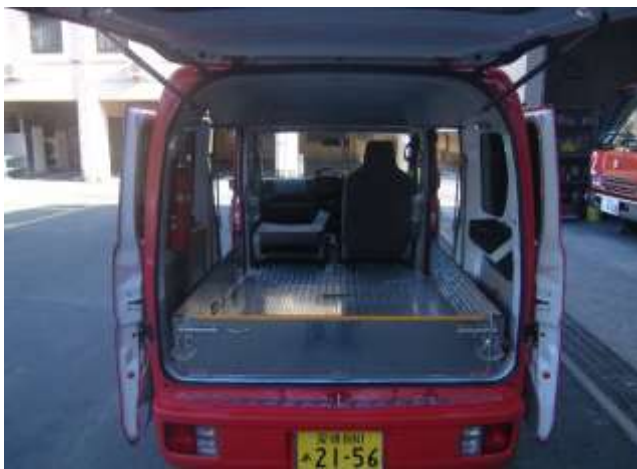
後部座席を収納し、収納ボックスのピンを解除し枠を拡張し、助手席座席を倒すことで収納スペース拡大。