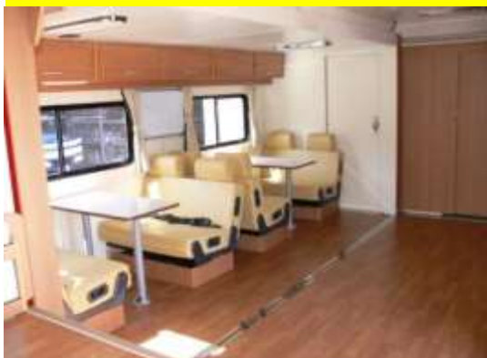
隊員が食事・休けいをする場所