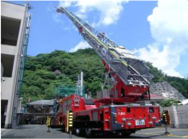
梯子を起伏・伸梯させた状況