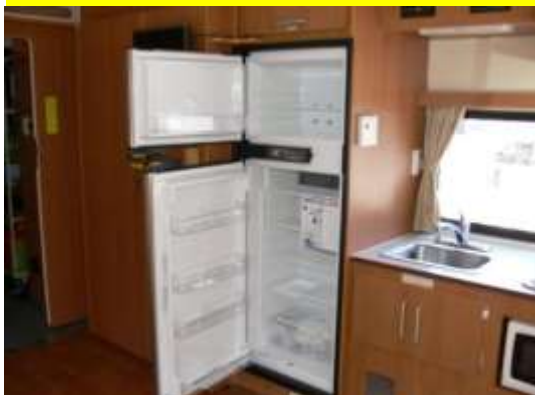
冷蔵庫・流し台などがあります。